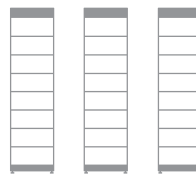
3 x HVM 22.1